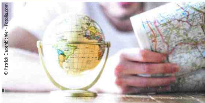
Eigener Hausstand im Inland Voraussetzung